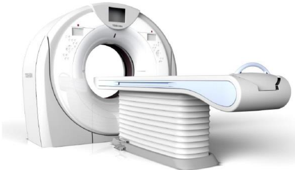
Aparelho de tomografia computadorizada Canon – Aquilion Prime – TSX-303A